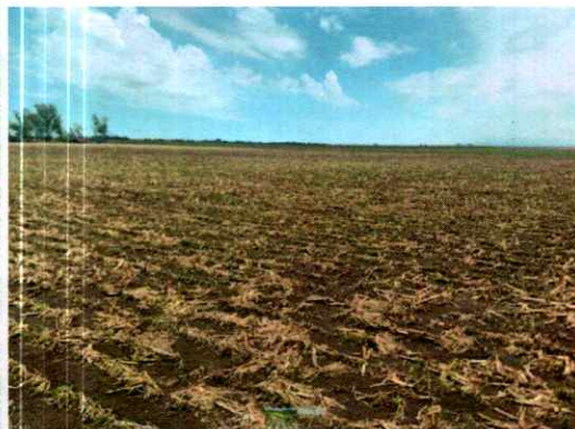
Foto Siniestro Maíz Campo Sirolesi