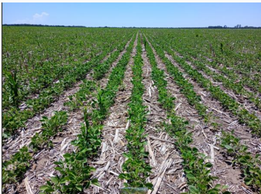
15 días antes de la tormenta