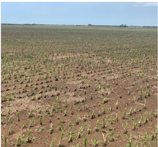
Después de la tormenta 31-12